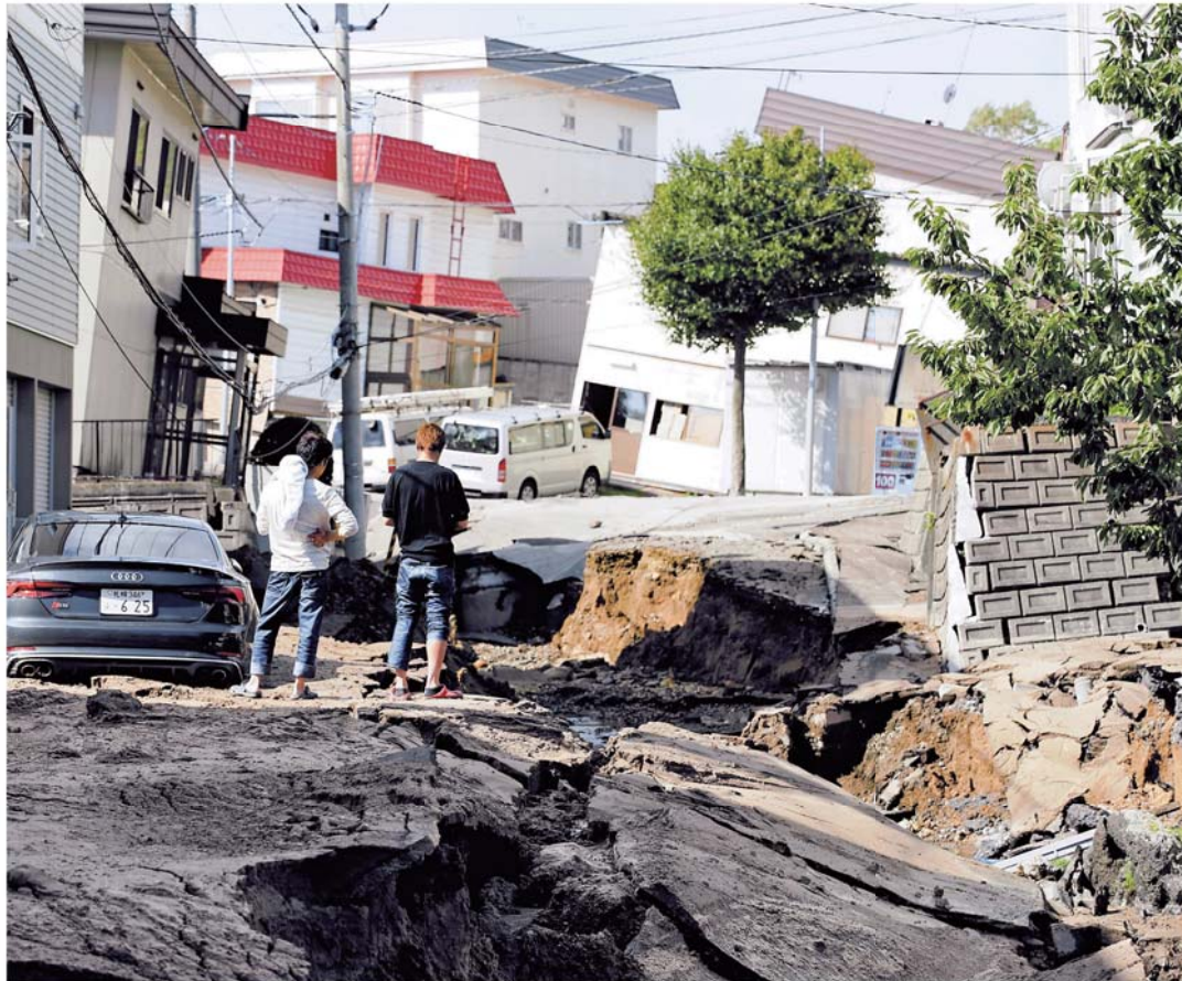
地震により陥没した道路と傾いた建物＝6日午前9時24分、札幌市清田区

6日午前3時8分ごろ北海道で、震度6強の地震があった。道警などによると、厚真町や安平町では土砂崩れや家屋倒壊などの大規模な被害が出ている。厚真町では19人が安否不明となっている。共同通信のまとめでは、札幌や苫小牧など5市で計110人が重軽傷を負った。道内全ての約295万戸が停電した。